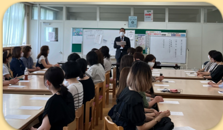
開級式 教頭先生のお話