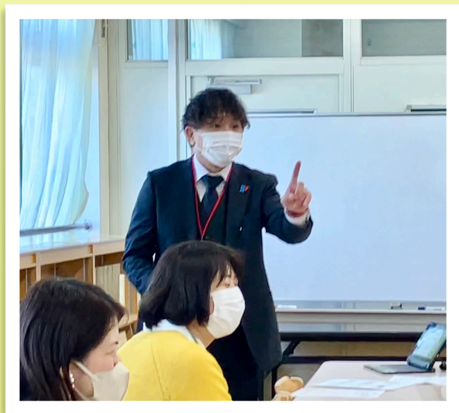
閉級式 校長先生のお話

スマホの使い過ぎが学力へどれほど影響を及ぼすかについてデータと共にお話をいただきました。