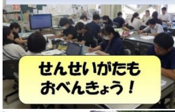
みやたしょうがっこうのなつやすみ③

今年もオンラインで行った「出会いの会」では恒例の「夏休みできたかな」チェックや「宮田小の夏休み」を紹介しました。みんな真剣に聞いてくれています!