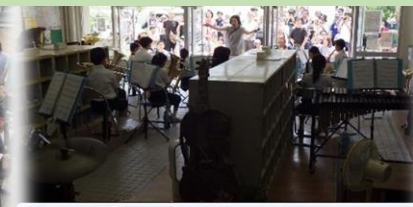
コンサートはしょうこうぐち!