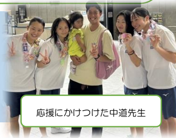
応援に駆けつけた中道先生