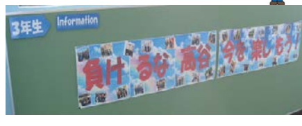
▲3年掲示板「負けるな!・・・」