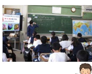
▲2年社会 (6/19 一斉授業)