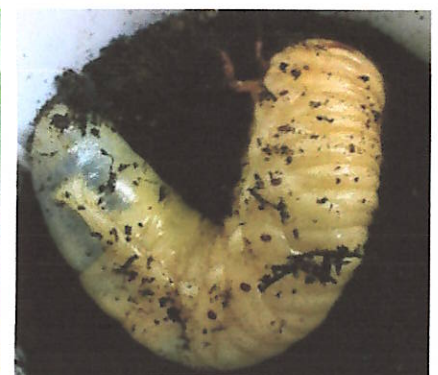
カブトムシの幼虫（大町小から）