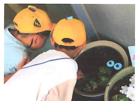
メダカの学校（職員玄関）

～学校はいつでも教育相談を受け付けています。小さな心配でもご相談ください。また、ゆとろぎ相談室前に相談したいことお手紙にして入れられる「ほっとルームお手紙ポスト」を設置しています。～