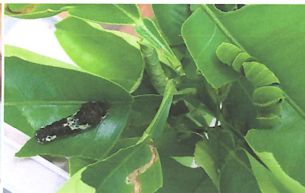
アゲハチョウの幼虫（3年生廊下）