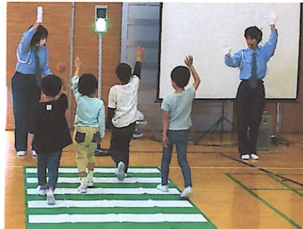
1・3年生交通安全教室