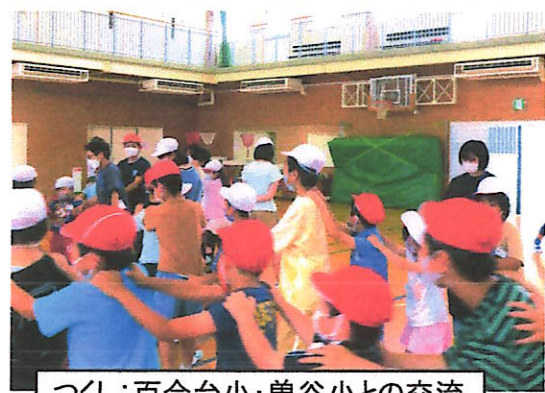
つくし：百合台小・曾谷小との交流