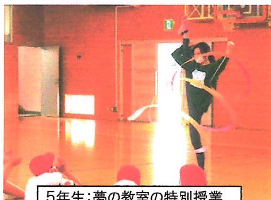
5年生：夢の教室の特別授業