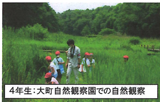
4年生：大町自然観察園での自然観察