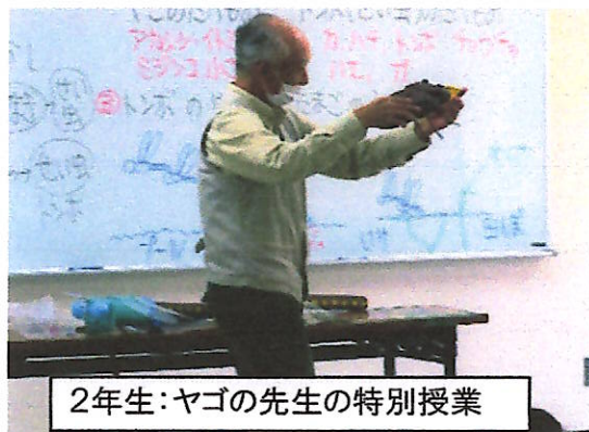
2年生：ヤゴの先生の特別授業