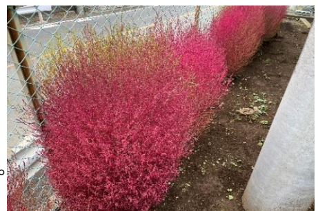
～黄緑から色鮮やかな赤へ～