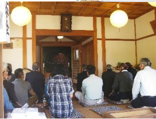
関係者のみ五穀豊穡の祈願風景

巖島神社の祭礼に合わせて稲越子ども会のお祭りも神社の境内をお借りして賑やかに行われているのですがここ2年はコロナ禍で中止になり、稲越巖島神社の祭礼も本来のすがたの、五穀豊穡をお願いする祭礼になりました。氏子さん達からは長く続いていた子ども会秋祭りが無いのは少し寂しいねとの声もありました。