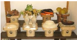
神にお供える供物