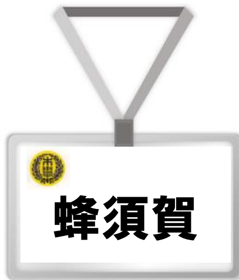
図1 透明な名札ケースに、サイズを合わせた用紙を用意し、名字をお書きください。

※校内で保護者の方々に名札を付けて頂く事は、保護者同士で名前を覚えて頂くこと、また、部外者と区別することで子供たちの安全を守ること等を目的としています。