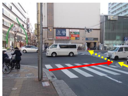
写真 9 歩者分離のため、異なる向きの信号が両方青に！