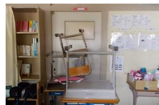
出入り口バリケード

「学校内に不審者が侵入した」というニュースを聞くことがあります。あってはならないことですが、学校には未然防止と「もしもの侵入」に備え、『危機管理マニュアル』があります。そこに記されている不審者侵入時の対応を確認するとともに防犯意識を高めるために、校舎内に不審者が侵入したことを想定した訓練を7月4日(火)に実施しました。緊急放送による不審者侵入の校内連絡・警察への通報・「さすまた」などを装備した職員による不審者への対応・教室出入り口の施錠及びバリケードの設置など、短時間の中でさまざまな行動を必要とする訓練でした。不審者侵入はあってはならないことですが、「もしもの侵入」の際には落ち着いて安全な行動がとれるよう、こうした訓練を積み重ね、今後に生かしていきます。