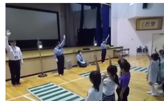
1年生 交通安全教室

自転車は身近で便利ですが、大きな事故につながる可能性があります。令和5年4月に道路交通法が改正され、全ての自転車利用者に対する乗車用ヘルメットの着用が努力義務になりました。自転車用のヘルメットは、転んだときや交通事故にあったときに、頭を衝撃から守ってくれます。交通事故の被害を軽減するためには、頭部を守ることがとても重要です。大切な命を守るために、ヘルメットを着用してほしいです。千葉県には、ヘルメットの着用を含め自転車に乗る前・自転車に乗るときのルールをまとめた「ちばサイクルルール」というものがあります。ご存じでしたでしょうか。夏季休業中にでもお子さんと一緒に、ぜひ確認をしていただければと思います。