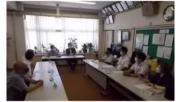
参観後の意見交換

また、3校時には、学校運営協議会委員の皆さんにも来校していただき、子供たちの様子を見ていただきました。委員の皆さんから「子供たちががんばっている姿がよかった。」という意見をたくさんいただきました。（学校運営協議会とは、市川市教育委員会から任命された地域住民、保護者の代表等の委員の皆さんが一定の権限と責任をもって学校運営に参画する「学校にある学校応援団」のことです。）