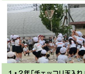
1・2年「チェッコリ玉入れ」