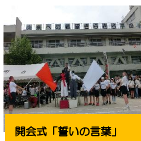
開会式「誓いの言葉」