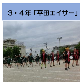
3・4年「平田エイサー」