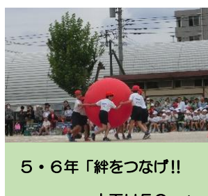
5・6年「絆をつなげ!! ～大玉UFO～」