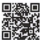
ジモティー トップページ