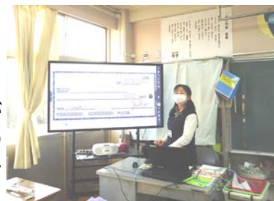
遠くからもよく見えます