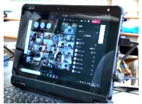
画面越しに先生の話聞きながら子どもたちが学習に取り組んでいます

まず、2月の半ばより、4年生以上の各学級では、欠席している児童に向けて、国語や算数等の授業のライブ配信を行っています。担任の先生は教室の黒板を撮影しながら授業を行い、欠席児童は自宅で自分のタブレットを使ってその様子を受信し、授業に参加します。また、先日、学級閉鎖となった学級では、教室にいる担任の先生と自宅にいる児童とがタブレットを用いてオンラインで通信しながら授業を行いました(写真)。