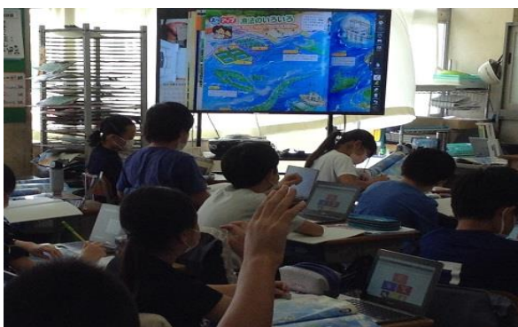
社会科の授業でのタブレット活用