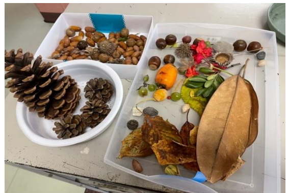
1年生 生活科 秋となかよし