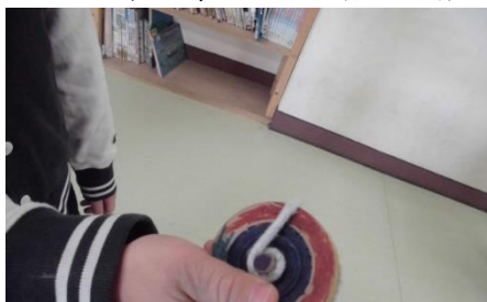
コマ回し 準備 OK