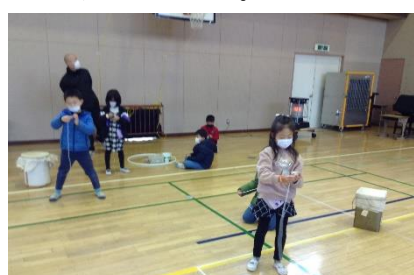
体育館で腕だめし