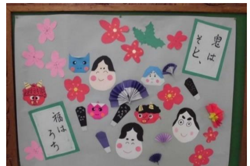
2月 掲示委員会の作品