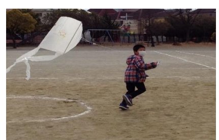
もっと高く！オリジナル凧