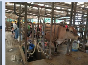
須藤牧場にて乳しぼり

<9月の集金> 引き落とし日9月27日 口座の残額をご確認くださいよう、お願いいたします。詳細は、前期末に会計報告をいたします。