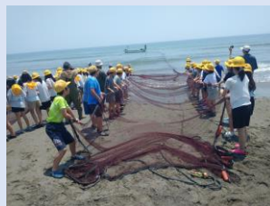
岩井海岸にて地引き網

南房総方面に出かけ、かなり暑い中でしたが、予定通り活動することができました。様々な体験を通して、集団行動の楽しさや難しさを学んだ2日間でした。