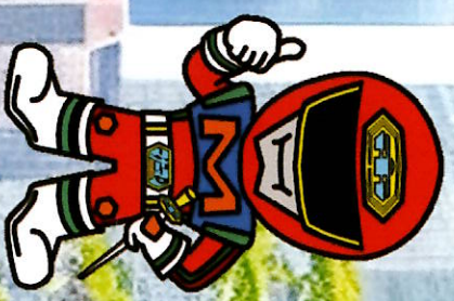
市民スナー条例 推進キャラクター スナーマン