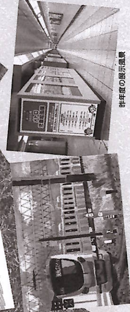
昨年年度の特選作品

【入賞者の発表】 2023年10月中旬頃、入賞者発表ポスターにて東京メトロ各駅に届出(奨励賞を除く)及びメトロ文化財団ホームページで発表(予定)