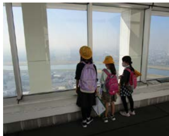
6年生 11月27日(金) 横浜八景島 シーパラダイス