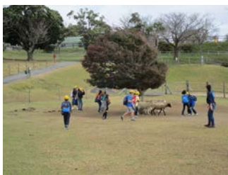
4年生 11月17日(火) 成田・佐原方面