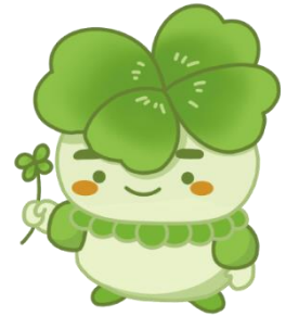
千葉県子どもと親のサポートセンター マスコットキャラクター こさぼん