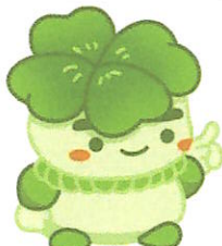
千葉県子どもと親のサポートセンター マスコットキャラクター こぼん