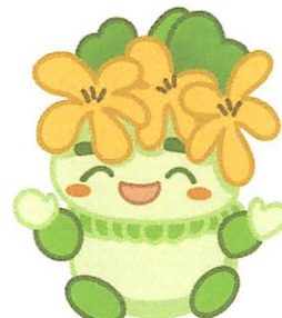
千葉県子どもと親のサポートセンター マスコットキャラクター こさぼん