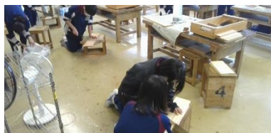
友達と協力して切断

あっという間に1年が経とうとしています。1年生は当初、中学校生活がわからず、苦労したことも多かったのではないのでしょうか。今では立派な中学生として様々な活躍をしていますね。今回は、オープンスクールで撮った授業風景です。