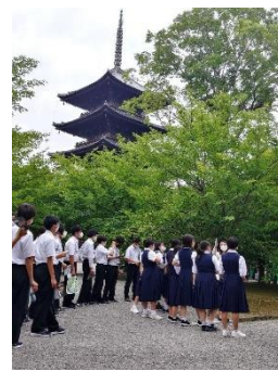
東寺の五重塔見学

保護者の皆様には出発前の感染対策の徹底、また、万が一の場合現地まで迎えに来ていただく場合もある、との条件で実施をさせていただきました。幸いにも疲れや乗り物酔いによる体調不良者が数名あっただけでした。皆様のご協力に改めて感謝申し上げます。