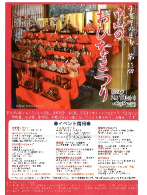
↑制作中のチラシ 詳細は掲示物をご覧ください

詳細は、中山地区のポスターなどでお知らせします。おひなさまを眺めながら、散策やイベントにお越しください。