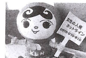
〔三中人権マスコット〕