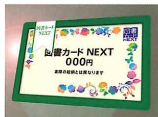
図書カードがもらえるよ