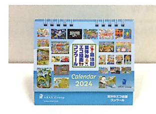
きみの作品がカレンダーに