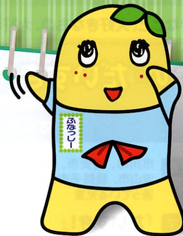
京葉ガスユーザー代表 梨の妖精「ふなっしー」 ©ふなっしー