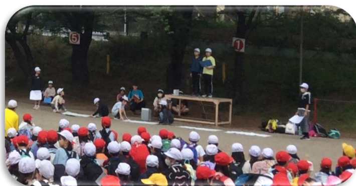
代表委員による〇×クイズの説明