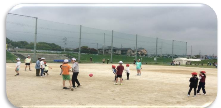
ペア学年の球技 大きい子が気を利かせます