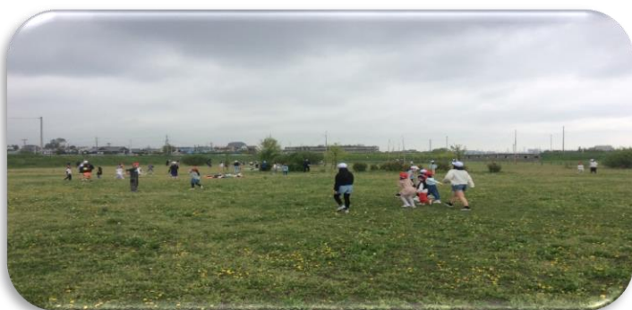
シロツメクサ(クローバー)やタンポポが咲いていました