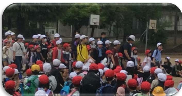
6年生と手をつないで入場する1年生

4月25日(金)に、校庭で行った1年生を迎える会では1年生と6年生が手をつないで入場しました。全校児童の前に立つ代表委員会の進行が素晴らしく、温かく1年生をお迎えすることができました。全校歩き遠足ではペア学年(1年生と6年生、2年生と4年生、3年生と5年生)中心に活動しました。曇りが幸いし、快適な気候で、楽しい時間を過ごすことができました。